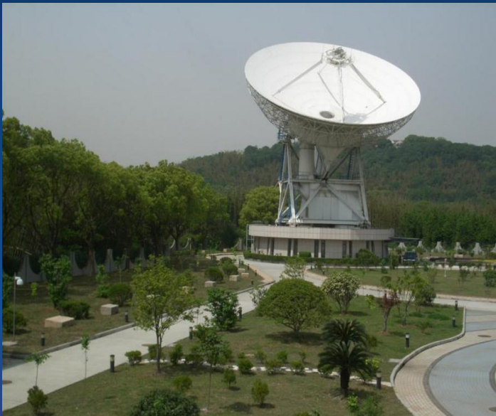
佘山 25 米射电望远镜

人类对星星的持续好奇心，使得天文学成为最早发展的几门科学之一。从肉眼观察星空到使用先进的射电望远镜，技术的不断进步，使得我们能够观察到宇宙的更深处。要实现宇宙细节的探测需要世界各地望远镜时常实时的完美合作。事实上，最精细的宇宙图像是通过分散在地球各处的射电望远镜取得的图像合成的。这种被称为甚长基线干涉测量（VLBI）的观测技术，可以达到比哈勃空间望远镜高一千倍的分辨率。由于这些天文观测生成的庞大数据需要快速共享才能创建更全面详尽的宇宙图像，高速网络如 GÉANT 和 ORIENTplus 的作用是至关重要的。