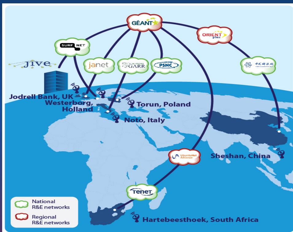
经由国家和地区教育科研网络，参加 ORIENTplus 发布演示会的世界各地望远镜的链接图

“随着 ORIENTplus 的线路升级，我们已经准备好以更高的带宽接入更多的中国望远镜。总之，欧洲和亚洲的望远镜给天文学家提供了更精密的仪器来观测天空。” JIVE 所长 Huib van Langevelde 说。